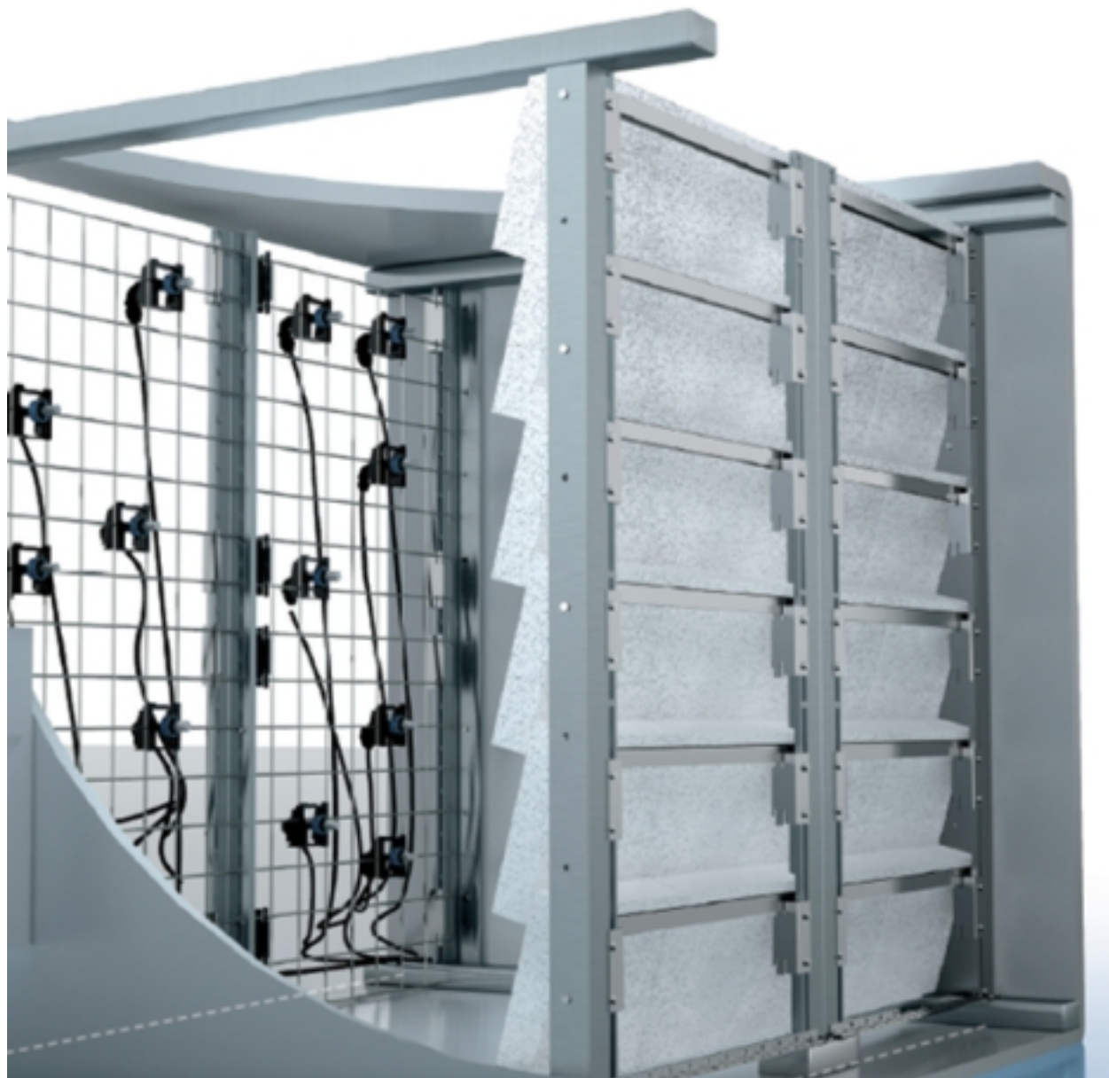
3D rendering of the Condair DL low-pressure water misting system. The image shows the internal components, including a grid of nozzles on the left, a central vertical panel with a jagged cutaway, and a series of horizontal trays on the right. The system is housed in a grey metal frame.