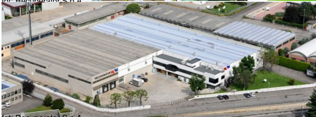
fot: Recuperator S.p.A