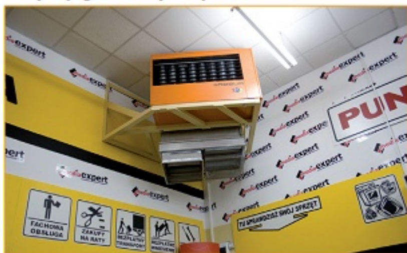
Nagroda za promowanie nagrzewania nadmuchowego: