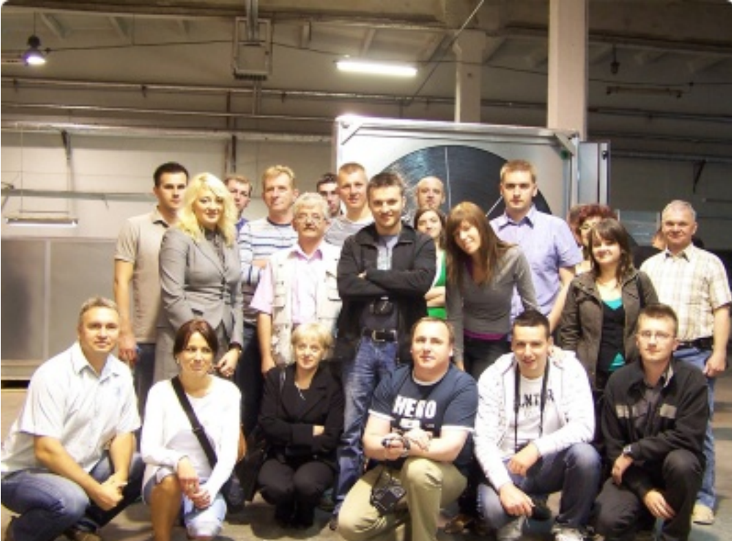
Klienci Centrum Klimy w fabryce central wentylacyjnych Komfovent w Wilnie