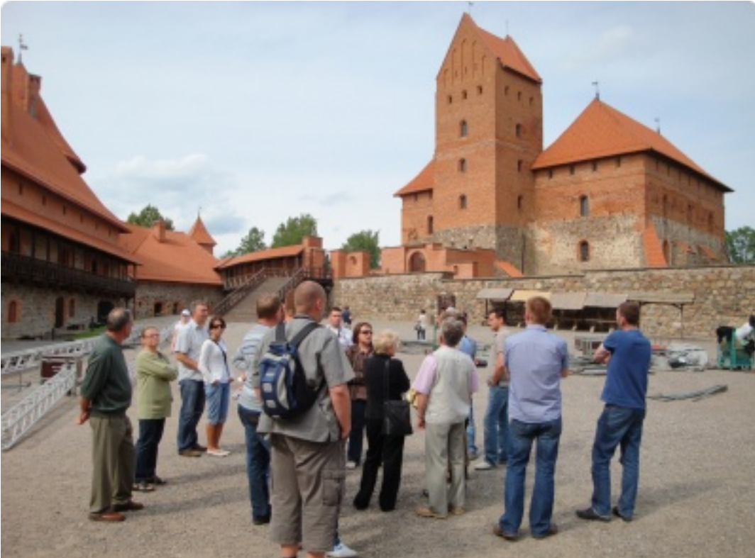
Klienci Centrum Klimy w fabryce central wentylacyjnych Komfovent w Wilnie