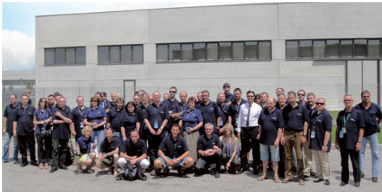
Uczestnicy wyjazdu do fabryki G.I. Industrial Holding SPA

Fabryka, którą uczestnicy mieli okazję zobaczyć, to jedna z sześciu lokalizacji koncernu produkująca klimakonwektory typu FVW/FIW oraz agregaty wody lodowej o wydajnościach od 200 do 9000 kW. W pozostałych pięciu fabrykach należących do G.I Holding produkowane są agregaty wody lodowej o mniejszych wydajnościach od 4 do 200 kW oraz urządzenia do klimatyzacji precyzyjnej.