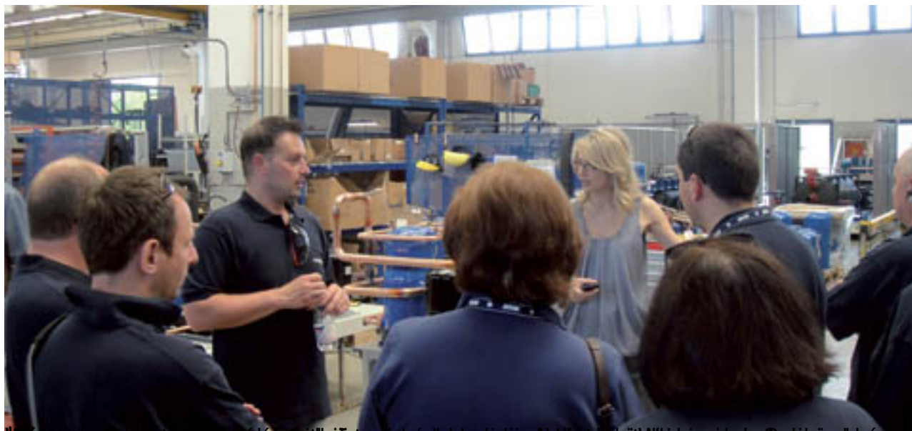
Właściciel, dyrektor, kierownik zespołu i inżynierowie w fabryce w Włoszech, podczas spotkania z projektantami.