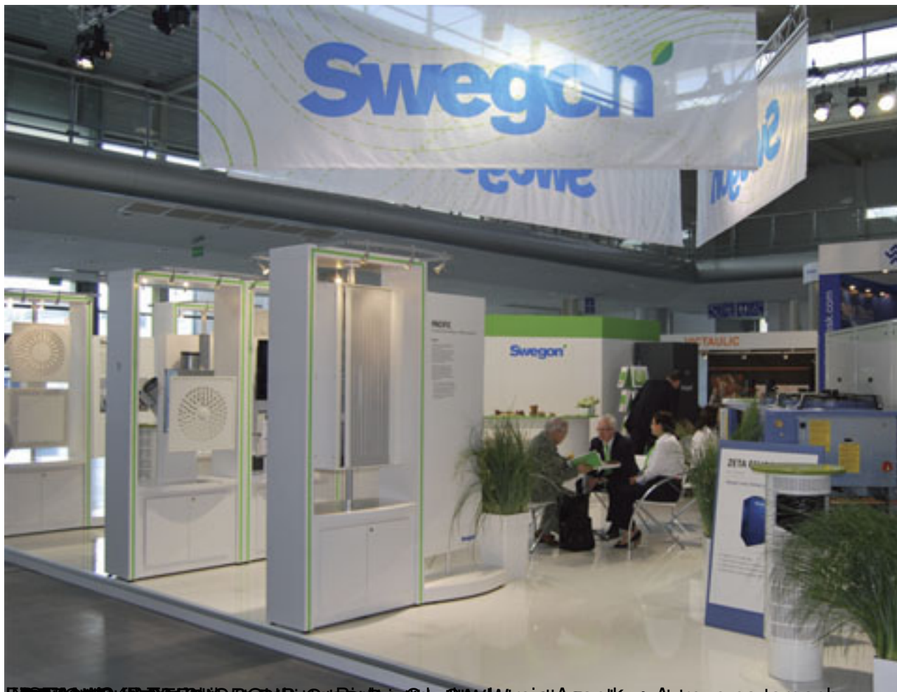
Instalacja wentylatorów i klimatyzatorów Swegon na targach