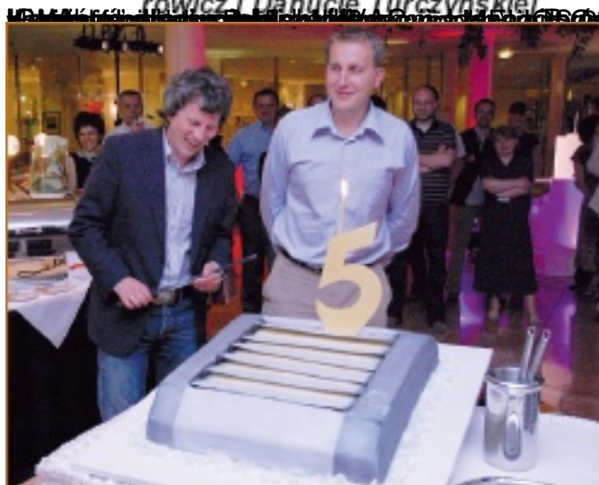
Fot. 6. Konferencja i gala były doskonałą okazją do uczczenia pięciu lat obecności firmy na rynku